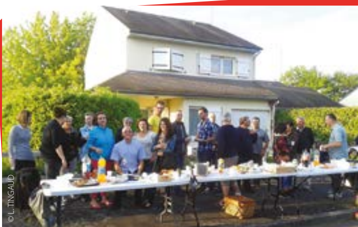
Ambiance conviviale lors de la "Fête des voisins".