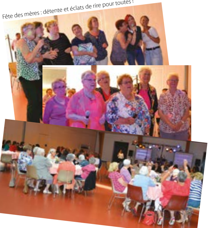
Fête des mères : détente et éclats de rire pour toutes !